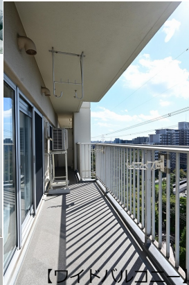
【ワイドバルコニー】